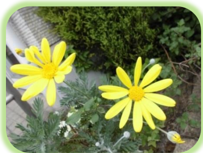
ユリオプスデージーとラベンダーが満開です。