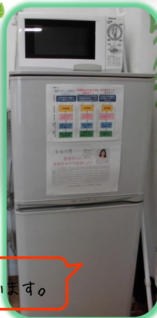
よく目に入る冷蔵庫に表を貼っています。