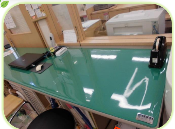
監査台のマットが新しくなりました。 つるつるのピカピカです。