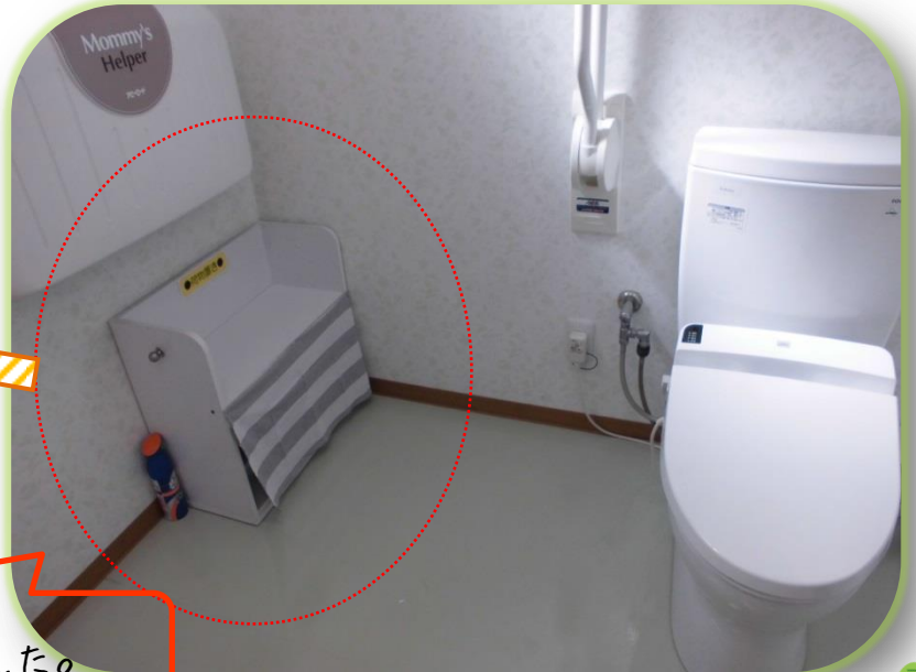
待合室のトイレの棚にカーテンが付きました。