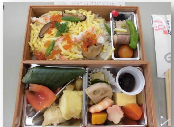
お楽しみ弁当会は、梅の花のお弁当でした。