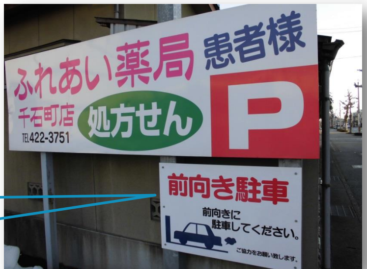
前向き駐車をお願いの看板を設置しました。