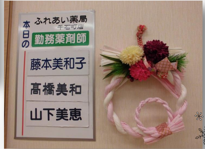
お正月飾りです。ピンクと白がお上品な飾りです。