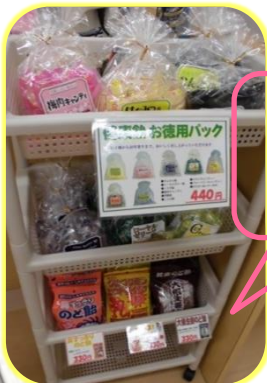
新しい商品です。 いろいろな種類の 飴です。