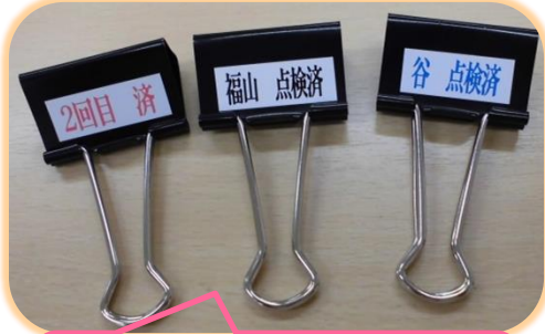
調剤録点検済みのクリップを作りました。