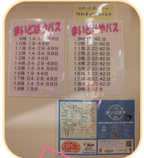
薬局の横を通るまいどはやバスのコースと時刻表が変更になります。