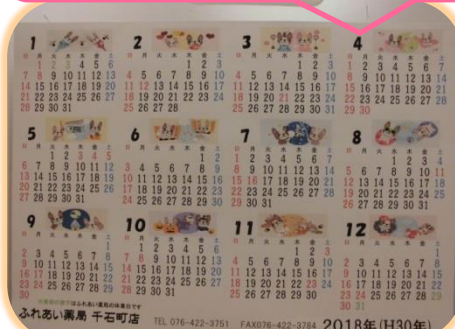
来年のカレンダーです。 ご希望の患者さんにお渡ししています。