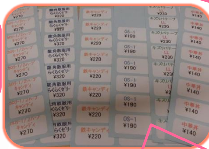
OTCや商品に付ける値札が手書きから印刷になりました。とても見やすいです。