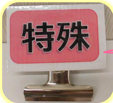
一包化の特殊分包の方に付けるクリップを作りました。